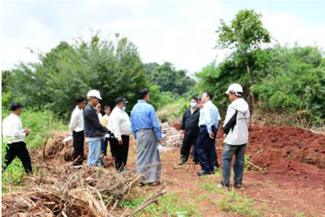
တောင်ကြီး၊ ဩဂုတ် ၂၀

ရှမ်းပြည်နယ်၊ တောင်ကြီးမြို့တွင်ရောက်ရှိနေသော မြန်မာနိုင်ငံ အိုလံပစ်ကော်မတီအတွင်းရေးမှူး၊ အားကစားနှင့်လူငယ်ရေးရာ ဝန်ကြီးဌာန ဒုတိယဝန်ကြီး ဦးထိန်လင်းသည် ယနေ့နံနက်ပိုင်းက ရှမ်းပြည်နယ် လေ့ကျင့်ရေးအားကစားရုံ၌ ကျင်းပပြုလုပ်သည့် ၂၀၂၅ ခုနှစ်၊ တိုင်းဒေသကြီးနှင့်ပြည်နယ် အမျိုးသားဖူဆယ်ပြိုင်ပွဲ ဖွင့်ပွဲအခမ်းအနားသို့ တက်ရောက်ခဲ့ပြီး အခမ်းအနားသို့ ရှမ်းပြည်နယ် အစိုးရအဖွဲ့၊ ပြည်နယ်ဝန်ကြီးချုပ် ဦးအောင်အောင်၊ ပြည်နယ် တရားလွှတ်တော် တရားသူကြီးချုပ်နှင့် ပြည်နယ်အစိုးရအဖွဲ့ဝင် ဝန်ကြီးများ၊ အားကစားနှင့်လူငယ်ရေးရာဝန်ကြီးဌာန ဒုတိယ အမြဲတမ်းအတွင်းဝန် ဦးကျော်ဆန်းနှင့် ဖိတ်ကြားထားသော ဧည့်သည်တော်များ၊ ပြည်နယ်အဆင့် ဌာနဆိုင်ရာအကြီးအကဲများ တက်ရောက်ခဲ့ကြသည်။