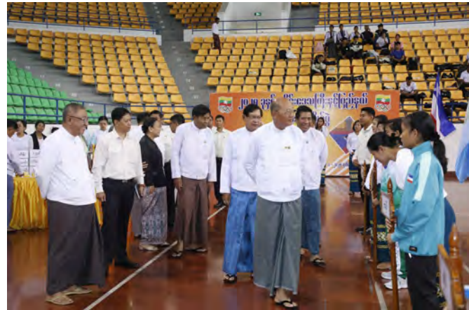
ရန်ကုန်၊ ဩဂုတ် ၁၅

မြန်မာ့သိုင်းအားကစားအဆင့်အတန်း ပိုမိုတိုးတက်မြှင့်မားလာစေရန်နှင့် မျိုးဆက်သစ်အားကစားသမားများစွာ ပေါ်ထွက်လာစေရန် ရည်ရွယ်ပြီး အားကစားနှင့်လူငယ်ရေးရာ