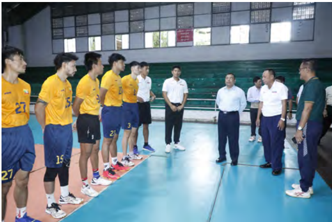
ရန်ကုန်၊ ဩဂုတ် ၉

အားကစားနှင့်လူငယ်ရေးရာဝန်ကြီးဌာန၊ ဒုတိယဝန်ကြီး ဦးထိန်လင်းသည် တာဝန်ရှိသူများလိုက်ပါလျက် ယနေ့နံနက်(၈)နာရီ အချိန်တွင် ရန်ကုန်တိုင်းဒေသကြီး၊ မင်္ဂလာတောင်ညွန့်မြို့နယ် အောင်ဆန်း အားကစားပြိုင်ဝင်းရှိ မိုးလုံလေလုံအားကစားရုံသို့ရောက်ရှိရာ မြန်မာနိုင်ငံ ဘော်လီဘောအဖွဲ့ချုပ်ဥက္ကဋ္ဌနှင့် တာဝန်ရှိသူများက ကြိုဆိုကြပြီး ဒုတိယ ဝန်ကြီးက ပဏာမလက်ရွေးစင် အမျိုးသား/အမျိုးသမီး ဘော်လီဘော အားကစားသမားများအား ရင်းရင်းနှီးနှီးလိုက်လံနှုတ်ဆက်၍ ကျန်းမာရေး ကို အထူးဂရုစိုက်ရန်၊ စည်းကမ်းရှိပြီး စနစ်တကျ လေ့ကျင့်ကြိုးစားကာ အကောင်းဆုံးလုပ်ဆောင်ကြရန်၊ နိုင်ငံနှင့်လူမျိုးအပေါ် တာဝန်ကျေပွန် အောင်ဆောင်ရွက်ရန်နှင့် (၃၃) ကြိမ်မြောက် အရှေ့တောင်အာရှ အားကစားပြိုင်ပွဲတွင် နိုင်ငံအလိုက်အဆင့်၌ တိုးတက်မြင့်မား အောင် ကြိုးစားကြရန်မှာကြားပြီး ပဏာမလက်ရွေးစင် (အမျိုးသား) ဘော်လီဘောအားကစားသမားများ လေ့ကျင့်နေမှုကို ကြည့်ရှု အားပေးခဲ့ပါသည်။