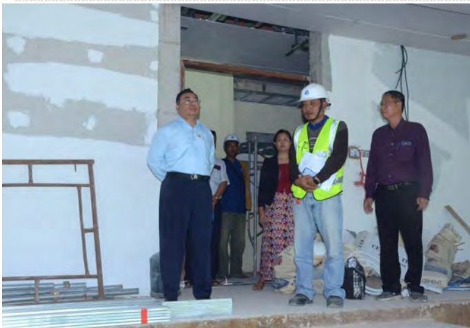
နေပြည်တော်၊ ဇန်နဝါရီ ၃၁

အားကစားနှင့်လူငယ်ရေးရာဝန်ကြီးဌာန ဒုတိယဝန်ကြီး ဦးထိန်လင်းသည် တာဝန်ရှိသူများလိုက်ပါလျက် ယနေ့နံနက်ပိုင်း တွင် မန္တလေးငလျင်အပြီး ဝဏ္ဏသိဒ္ဓိအားကစားကွင်းအတွင်းရှိ ဘောလုံးကွင်း၊ မီတာ ၄၀၀ Synthetic ရာဘာပြေးလမ်း ခင်းကျင်း