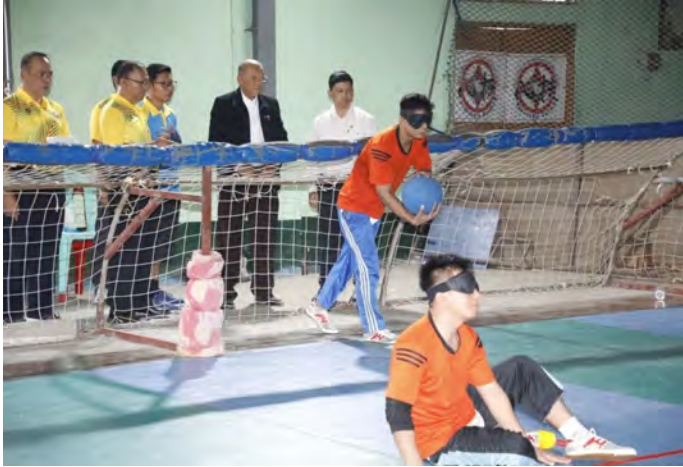
ရန်ကုန်၊ ဇန်နဝါရီ ၁၄

မြန်မာနိုင်ငံအိုလံပစ်ကော်မတီဥက္ကဋ္ဌ၊ အားကစားနှင့်လူငယ်ရေးရာဝန်ကြီးဌာနနှင့် ဟိုတယ်နှင့်ခရီးသွားလာရေးဝန်ကြီးဌာန ပြည်ထောင်စုဝန်ကြီး Jeng Phang နော်တောင်သည် အားကစားနှင့်ကာယပညာဦးစီးဌာန ညွှန်ကြားရေးမှူးချုပ် ဦးညွှန်ဇော်ဦးနှင့် တာဝန်ရှိသူများလိုက်ပါလျက် ယမန်နေ့ညနေပိုင်းတွင် ဒဂုံမြို့သစ်မြောက်ပိုင်းရှိ မြန်မာနိုင်ငံမသန်စွမ်းအားကစားအဖွဲ့ချုပ်သို့ သွားရောက်၍ 13 th Asean Para Games ဝင်ရောက်ယှဉ်ပြိုင်မည့်