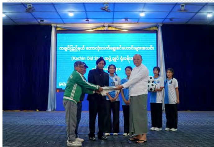
မြစ်ကြီးနားမြို့၊ ဇန်နဝါရီလ ၂၀

မြန်မာနိုင်ငံအိုလံပစ်ကော်မတီဥက္ကဋ္ဌ၊ အားကစားနှင့်လူငယ်ရေးရာ ဝန်ကြီးဌာနနှင့် ဟိုတယ်နှင့်ခရီးသွားလာရေးဝန်ကြီးဌာန ပြည်ထောင်စု ဝန်ကြီး Jeng Phang နော်တောင်သည် ကချင်ပြည်နယ် ဘောလုံး လက်ရွေးစင်ဟောင်းများအသင်း (Kachin Old Star) အဖွဲ့ချုပ် ရုံးခန်းသစ်ဖွင့်ပွဲအခမ်းအနားသို့ တက်ရောက်ခဲ့ပြီး ကချင်ဘောလုံး အကယ်ဒမီ၏ အဆင့်မြင့် (၃) လသင်တန်း U-14 ၊ U-17 နှင့် အမျိုးသမီး U-25 ဘောလုံးအသင်းများ၏ လေ့ကျင့်မှုများကို ကြည့်ရှုစစ်ဆေးကာ အားကစားဝတ်စုံများ ထောက်ပံ့ပေးအပ် ခဲ့ပါသည်။