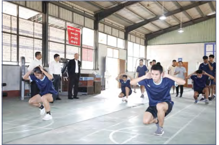
ရန်ကုန်၊ ဇန်နဝါရီ ၁၅

မြန်မာနိုင်ငံအိုလံပစ်ကော်မတီ ဥက္ကဋ္ဌ၊ အားကစားနှင့်လူငယ်ရေးရာဝန်ကြီးဌာနနှင့် ဟိုတယ်နှင့်ခရီးသွားလာရေးဝန်ကြီးဌာန ပြည်ထောင်စုဝန်ကြီး Jeng Phang နော်တောင်သည် ညွှန်ကြားရေးမှူးချုပ် ဦးညွှန်ဝင်းနှင့် တာဝန်ရှိသူများလိုက်ပါလျက် ယမန်နေ့ ညနေပိုင်းတွင် ကျိုက္ကဆံကွင်းအတွင်းရှိ အားကစားနှင့်ကာယပညာသိပ္ပံ (ရန်ကုန်)မှ အုပ်ချုပ်/နည်းပြများနှင့် အားကစားသမားများ၏ အားကစားနည်းအလိုက် လေ့ကျင့်နေမှုများကို လိုက်လံကြည့်ရှု စစ်ဆေးခဲ့သည်။