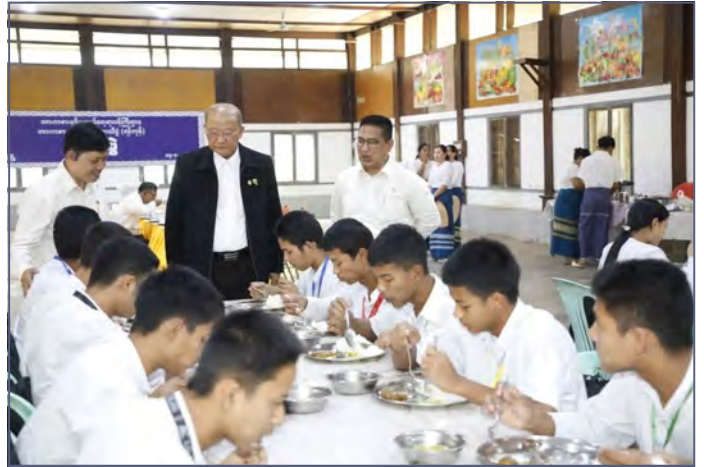
မသန်စွမ်းအားကစားအဖွဲ့များ၏ လေ့ကျင့်နေမှုများအား လိုက်လံကြည့်ရှုအားပေးခဲ့သည်။

မြန်မာနိုင်ငံအိုလံပစ်ကော်မတီဥက္ကဋ္ဌ၊ အားကစားနှင့်လူငယ်ရေးရာဝန်ကြီးဌာနနှင့် ဟိုတယ်နှင့်ခရီးသွားလာရေးဝန်ကြီးဌာန ပြည်ထောင်စုဝန်ကြီး Jeng Phang နော်တောင်သည် အားကစားနှင့်ကာယပညာဦးစီးဌာန ညွှန်ကြားရေးမှူးချုပ် ဦးညွှန်ဇော်ဦးနှင့် တာဝန်ရှိသူများလိုက်ပါလျက် ယမန်နေ့ညနေပိုင်းတွင် ဒဂုံမြို့သစ်မြောက်ပိုင်းရှိ မြန်မာနိုင်ငံမသန်စွမ်းအားကစားအဖွဲ့ချုပ်သို့ သွားရောက်၍ 13 th Asean Para Games ဝင်ရောက်ယှဉ်ပြိုင်မည့်