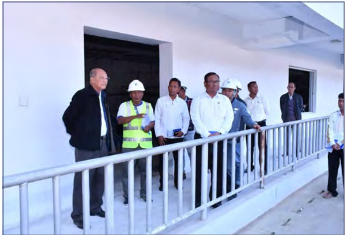
နေပြည်တော်၊ ဇန်နဝါရီ ၁၈

မြန်မာနိုင်ငံအိုလံပစ်ကော်မတီဥက္ကဋ္ဌ၊ အားကစားနှင့်လူငယ်ရေးရာ ဝန်ကြီးဌာနနှင့် ဟိုတယ်နှင့်ခရီးသွားလာရေးဝန်ကြီးဌာန ပြည်ထောင်စု ဝန်ကြီး Jeng Phang နော်တောင်သည် မန္တလေးတိုင်းဒေသကြီး အားကစားနှင့်ကာယပညာဦးစီးဌာန ညွှန်ကြားရေးမှူးနှင့်အတူ တာဝန်ရှိသူများလိုက်ပါလျက် ယနေ့နံနက်ပိုင်းတွင် မန္တလေးငလျင် ဒဏ်ကြောင့် ထိခိုက်ပျက်စီးခဲ့သည့် မန္တလေးတိုင်းဒေသကြီးအတွင်းရှိ အားကစားကွင်း/အားကစားရုံများအား ငလျင်အပြီး တည်ဆောက် ရေးလုပ်ငန်း ပြန်လည်ပြုပြင်ဆောင်ရွက်နေမှုအခြေအနေများအား လိုက်လံကြည့်ရှုစစ်ဆေးခဲ့သည်။