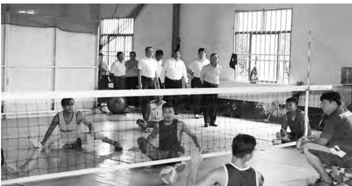
▶ စာမျက်နှာ(၄၇) ... မှအဆက်

ကြေး ဆုတံဆိပ်များကို ဆွတ်ခူးရယူပေးခဲ့ပါကြောင်း၊ ယခု ၂၀၂၃ ခုနှစ်၊ တရုတ်ပြည်သူ့သမ္မတနိုင်ငံ၊ ဟန်ကျိုးမြို့မှာကျင်းပပြုလုပ်မည့် (၁၉)ကြိမ်မြောက် အာရှအားကစားပြိုင်ပွဲမှာ ရိုးရာလှေပြိုင်ပွဲ ဝင်ရောက်ယှဉ်ပြိုင်သွားမှာဖြစ်ကြောင်း၊ လှေလှော်အားကစားနည်းရဲ့ ရရှိထားသည့် အောင်မြင်မှုများကို ဆက်လက်ထိန်းသိမ်းပြီး အရှေ့တောင်အာရှအဆင့်မှ အာရှအဆင့် အာရှအဆင့်မှကမ္ဘာ့အဆင့်ထိ တက်လှမ်းနိုင်အောင် ကြိုးစားသွားရန် လိုအပ်ကြောင်း၊ အားကစားသမားများ အနေဖြင့် ပြိုင်ပွဲစည်းမျဉ်း/စည်းကမ်းဥပဒေများကို လေးစားလိုက်နာကြရန်၊ ခိုင်လုံကြီးများကလည်း သမာသမတ်ရှိရှိ တရားမျှတမှန်ကန်စွာ ဆုံးဖြတ်ဆောင်ရွက်ကြရန်၊ လှေလှော်အားကစားနည်း ဆောင်ပုဒ်ဖြစ်တဲ့ "လှေခွက်ချည်းကျန်အလံမလှဲ သေသည် တိုင်အောင် တက်ကိုဆောင်၊ တက်ညီလက်ညီ ရှေ့သို့ချီ ဆိုတဲ့ဆောင်ပုဒ်အတိုင်း ကြိုးစားဆောင်ရွက်သွားရန် တိုက်တွန်း ပြောကြားခဲ့ပါသည်။