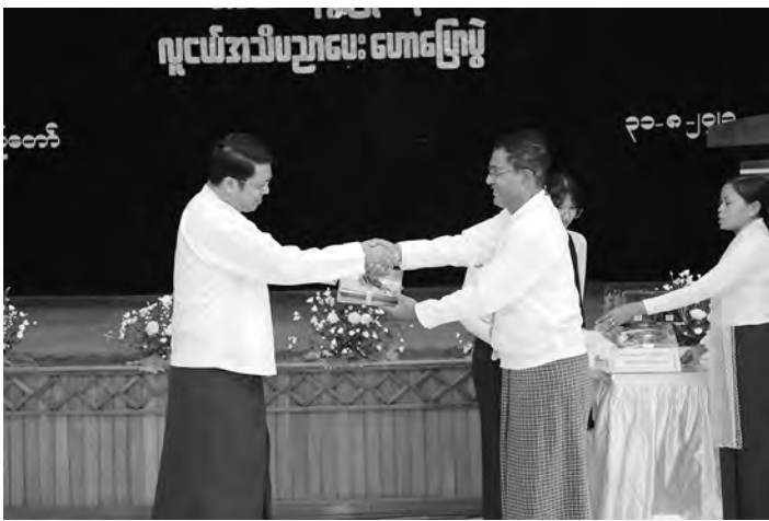
စာမျက်နှာ(၅၇)မှအဆက်

ပြောကြားရာတွင် လူငယ်များသည် နိုင်ငံ၏ အနာဂတ်ဖြစ်သည့်အတွက် အသိပညာ၊ အတတ်ပညာများပြည့်စုံ နေရန်လိုကြောင်း၊ ထို့ကြောင့် အသိပညာ အတတ်ပညာ အပါအဝင် ဗလင်းတန်ဖွံ့ဖြိုးစေမည့် ပညာရေး စနစ် တစ်နည်းအားဖြင့် ဘက်စုံပညာ ရေးစနစ်ကို အကောင်အထည်ဖော် နေပါကြောင်း၊ ဘက်စုံပညာရေးသည် ကျယ်ပြန့်ပါကြောင်း၊ ဘက်စုံပညာ ရေးတွင် ထူးချွန်ရမည့် ရှိရမည့် အရည်အသွေးများ များစွာပါဝင်ပါ ကြောင်း။