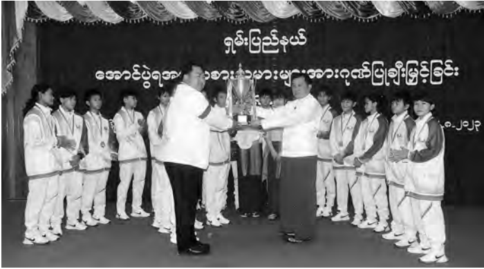
● တောင်ကြီး၊ ဩဂုတ်လ(၂)ရက်။ ၂၀၂၃-၂၀၂၄ ဘဏ္ဍာရေးနှစ် အတွင်း ယှဉ်ပြိုင်ခဲ့သည့် ပြည်နယ်နှင့် တိုင်းဒေသကြီး အားကစားပြိုင်ပွဲများ တွင် အောင်မြင်မှုရရှိခဲ့သည့် ရှမ်းပြည်နယ်ဂုဏ်ဆောင် အားကစားသမားများအား ဂုဏ်ပြုချီးမြှင့်ခြင်းကို ယနေ့ညနေ ၃ နာရီက တောင်ကြီးမြို့