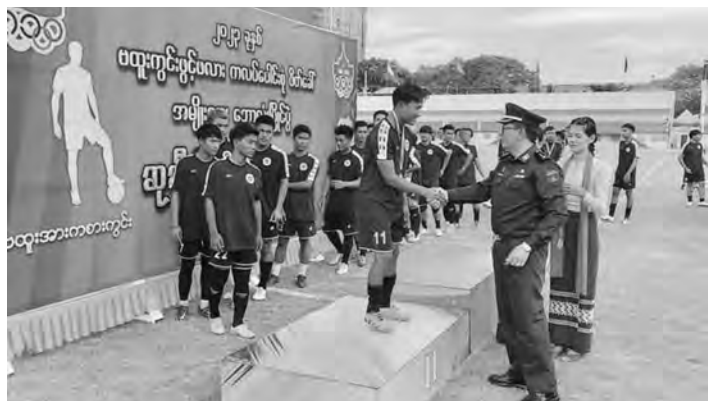
စာမျက်နှာ(၂၉)မှအဆက်

လုပ်ရာ အဆိုပါပြိုင်ပွဲသို့ ကလပ် အသင်း(၁၆)သင်း ပါဝင်ယှဉ်ပြိုင် ကစားခဲ့ကြပါသည်။