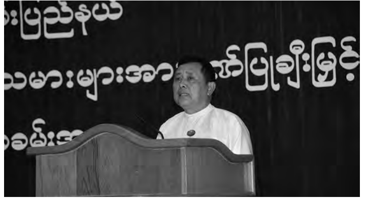
ရှမ်းပြည်နယ်အစိုးရအဖွဲ့ရုံး အစည်းအဝေးခန်းမ၌ ကျင်းပသည်။ ဂုဏ်ပြုချီးမြှင့်ပွဲတွင် ရှမ်းပြည်နယ် ဝန်ကြီးချုပ် ဦးအောင်ဇော်အေးက ရှမ်းပြည်နယ် ဖူဆယ်ဘောလုံးအသင်း အောင်မြင်မှု အသီးအပွင့် ခံစားလာရသည်မှာ ရှမ်းပြည်နယ်အတွင်း ဖူဆယ် စာမျက်နှာ(၂)သို့ ▶