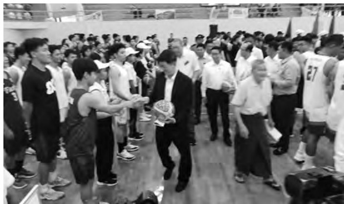
အားကစား သစ္စာအဓိဋ္ဌာန်ရွတ်ဆိုကြ ပြီး တိုင်းဒေသကြီးဝန်ကြီးချုပ်နှင့် အဖွဲ့က အားကစားသမားများကို လိုက်လံနှုတ်ဆက်ကာ အားကစား ပစ္စည်းများပေးအပ်၍ အားကစား အသင်းအလိုက် ယှဉ်ပြိုင်ကစားနေ မှုများကို ကြည့်ရှုအားပေးသည်။ မန္တလေးမြို့၊ ဗထူးမိုးလုံလေလုံ

▶ စာမျက်နှာ(၃၁)•••မှအဆက် အခမ်းအနားတွင် တိုင်းဒေသ ကြီးဝန်ကြီးချုပ်က အားကစားသည် နိုင်ငံတစ်နိုင်ငံ၏ ဂုဏ်သိက္ခာဖြစ်သည့် အတွက် ကမ္ဘာ့နိုင်ငံတိုင်းက အား ကစားကို အမျိုးသားရေးတာဝန်တစ် ရပ်အဖြစ် ရှေ့လှုပ်ဆောင်လာကြပြီး မြန်မာနိုင်ငံအနေဖြင့်လည်း အား ကစားကဏ္ဍ ဖွံ့ဖြိုးတိုးတက်လာစေ ရေးအတွက် အမျိုးသားရေးတာဝန် အဖြစ် ခံယူပြီး ဘက်စုံထောင့်စုံမှ အကောင်းဆုံးဖြစ်အောင် ဆောင်ရွက် နေပါကြောင်း ပြောကြားပြီး ပြိုင်ပွဲကို စတင်ဖွင့်လှစ်ပေးသည်။ ထို့နောက် ပြိုင်ပွဲဝင် အားကစားသမားများက