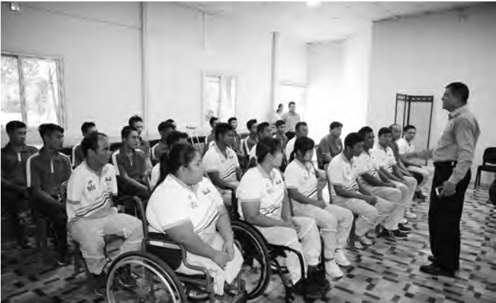
ပေးပြီး ဆုတံဆိပ်ရရှိခဲ့သည့် အားကစားသမားများကိုလည်း ဘဝအာမခံ