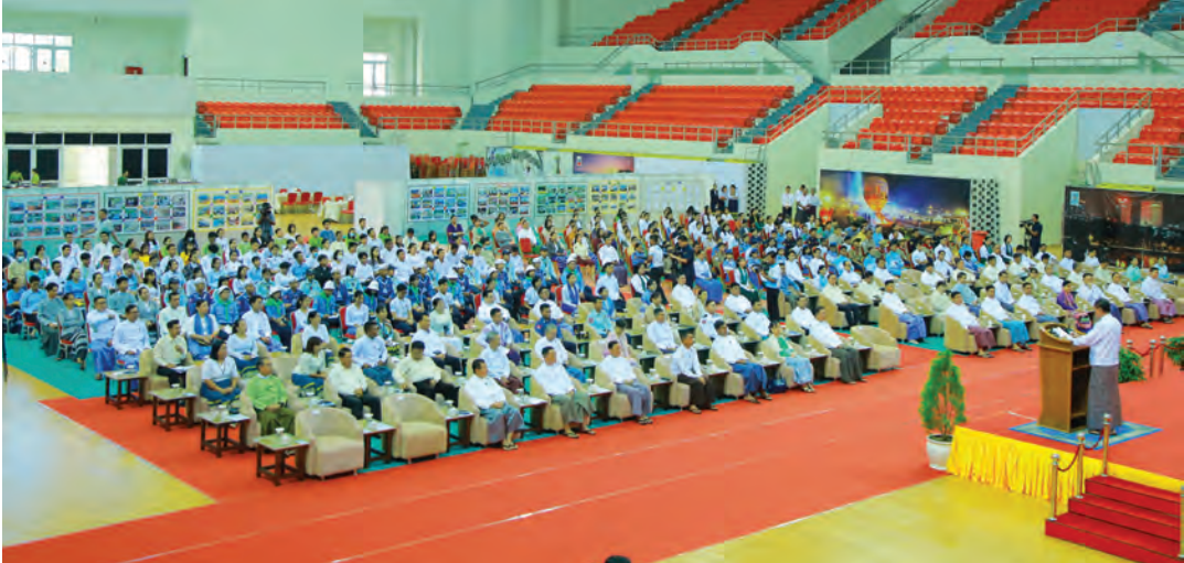
စာမျက်နှာ(၇၀)သို့ ▶

လူငယ်များအတွက် အလေးထား ဆောင်ရွက်ရမည့် ကဏ္ဍများဖြစ် ကြောင်း၊ လူငယ်များကိုမှန်ကန်သည့် လမ်းကြောင်းပေါ်သို့ ရောက်ရှိစေပြီး နိုင်ငံတော်ကို အကျိုးပြုမည့် နိုင်ငံ့ သားကောင်းများ ဖြစ်လာစေရေး အတွက် သက်ဆိုင်ရာဌာနများနှင့် အဖွဲ့အစည်းများမှ အကောင်အထည် ဖော် ဆောင်ရွက်လျက်ရှိကြောင်း၊ နေပြည်တော်ကောင်စီ အပါအဝင် တိုင်းဒေသကြီးနှင့် ပြည်နယ်များတွင် မြန်မာနိုင်ငံ လူငယ်ရေးရာဗဟို ကော်မတီ၊ မြန်မာနိုင်ငံလူငယ်ရေးရာ လုပ်ငန်းကော်မတီနှင့် လူငယ်ရေးရာ ကော်မတီများကို ဖွဲ့စည်းပေးခဲ့ပြီးဖြစ် ကြောင်း၊ လူငယ်များ ဘက်စုံဖွံ့ဖြိုး တိုးတက်စေရေးအတွက် အကောင် အထည်ဖော် ဆောင်ရွက်ရာတွင် ဦးဆောင် ဝန်ကြီးဌာနများဖြစ်သည့် အားကစားနှင့် လူငယ်ရေးရာဝန်ကြီး ဌာန၊ ပညာရေးဝန်ကြီးဌာန၊ သိပ္ပံနှင့် နည်းပညာဝန်ကြီးဌာန၊ လူမှုဝန်ထမ်း၊ ကယ်ဆယ်ရေးနှင့် ပြန်လည်နေရာချ ထားရေး ဝန်ကြီးဌာနများ အပါအဝင် ပြည်ထောင်စုဝန်ကြီးဌာနများ၊ တိုင်း ဒေသကြီးနှင့် ပြည်နယ်အစိုးရအဖွဲ့ များနှင့်အတူ ပြည်သူတစ်ရပ်လုံးက အမျိုးသားရေးအသိဖြင့် ဝိုင်းဝန်းပူး ပေါင်း ဆောင်ရွက်သွားကြရမည်ဖြစ် ကြောင်း၊ ယနေ့အခမ်းအနားတွင် ထူးချွန်သည့် နိုင်ငံ့ဂုဏ်ဆောင်လူငယ် မောင်/မယ်များကို ဂုဏ်ပြုဆုငွေများ