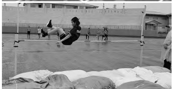
▶▶▶ ထိုနောက် ပြည်နယ်ဝန်ကြီးချုပ်၊ ပြည်နယ် တရားလွှတ်တော် တရားသူကြီးချုပ် ဒေါ်ခင်ဆွေထွန်း၊ ပြည်နယ်အစိုးရအဖွဲ့ဝင်များ၊ ပြည်နယ်အဆင့် ဌာနဆိုင်ရာများ၊ အားကစား