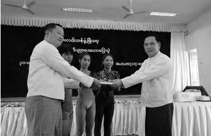
စာမျက်နှာ(၁၇) ••• မှအဆက်

ယင်းနောက် ပြည်ထောင်စုဝန်ကြီး ဦးမောင်မောင်အုန်းက နှုတ်ခွန်းဆက် စကား ပြောကြားရာတွင် ကျောင်း သား/ကျောင်းသူများ မှန်ကန်သည့် အသိပညာများ ရရှိစေရေးအတွက် ယနေ့စာပေဟောပြောပွဲကို ကျင်းပရ ခြင်းဖြစ်ကြောင်း၊ ဆရာမကြီး ဒေါ်မေ ကျော့ရှင်း၏ ဟောပြောဆွေးနွေးချက် များကို စိတ်ဝင်စားစွာ နားထောင်မှတ် သားစေလိုကြောင်း၊ ကျောင်းသား/ ကျောင်းသူများအနေဖြင့် မိမိကိုယ်မိမိ ယုံကြည်မှုနှင့် ရဲရင့်မှုရှိရန် လိုအပ် ကြောင်း၊ နိုင်ငံတော်ဝန်ကြီးချုပ် အနေဖြင့်လည်း အနာဂတ်ခေါင်း ဆောင်များဖြစ်လာမည့် ကျောင်းသား/ ကျောင်းသူများကို အလေးထားတန်ဖိုး ထားပါကြောင်း၊ ကျောင်းသား/ ကျောင်းသူများ ပလဝါးတန်နှင့်ပတ် သက်၍ ပိုမိုသိရှိနားလည်ပြီး မှန်ကန် သည့်အသိပညာများရရှိစေရန် ကျောင်း များသို့သွားရောက်၍ ဆွေးနွေးဟော