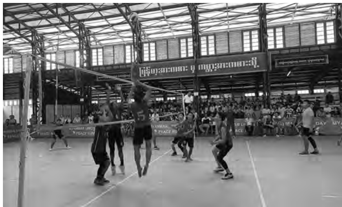
ဒေသကြီးအဆင့် ဌာနဆိုင်ရာအကြီး အကဲများ၊မြို့နယ်များမှ ဘော်လီဘော အားကစားသမားများနှင့် အားကစား ဝါသနာရှင်များ တက်ရောက်ကြည့်ရှု အားပေးကြပါသည်။ အစီအစဉ်အရ အမျိုးသားဘော်

● တနင်္သာရီ၊ ဩဂုတ်လ(၂၂)ရက်။ ၂၀၂၂ ခုနှစ်၊ တနင်္သာရီတိုင်း ဒေသကြီး အစိုးရအဖွဲ့ ဝန်ကြီးချုပ် ဖလား မြို့နယ်ပေါင်းစုံ အမျိုးသား/ အမျိုးသမီး ဘော်လီဘောပြိုင်ပွဲ ဗိုလ် လုပွဲနှင့် ဆုချီးမြှင့်ပွဲအခမ်းအနားကို ယနေ့နံနက် (၉)နာရီအချိန်တွင် ထားဝယ်မြို့ ရွှေဝယ်သီရိ အားကစား ခန်းမ၌ ကျင်းပပြုလုပ်ရာ အခမ်း အနားသို့ တနင်္သာရီတိုင်းဒေသကြီး အစိုးရအဖွဲ့ ဝန်ကြီးချုပ် ဦးမြတ်ကို၊ တိုင်းဒေသကြီး တရားလွှတ်တော် တရားသူကြီးချုပ် ဒေါ်ပိုက်ပိုက်အေး နှင့်အစိုးရအဖွဲ့ဝင် ဝန်ကြီးများ၊ တိုင်း