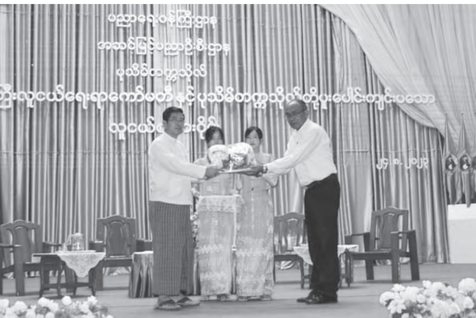
စပျက်နာ(၃၈)သို့

လူငယ်တို့ ရင်ဆိုင်ကြုံတွေ့နေရသည့် စိန်ခေါ်မှုပြဿနာများကို ဖြေရှင်းကျော်လွှား၍ မြန်မာနိုင်ငံရှိ လူငယ်များ၏ လူမှုရေး၊ စီးပွားရေး၊ နိုင်ငံရေး၊ ပညာရေး၊ ယဉ်ကျေးမှု၊ ဖွံ့ဖြိုးမှု အနာဂတ်အလားအလာကောင်းများကို ရှေ့ဆောင်လမ်းပြပေးနိုင်ရန် လူငယ်ရေးရာမူဝါဒကို ၂၀၁၇ ခုနှစ်တွင် ရေးဆွဲပြဋ္ဌာန်းနိုင်ခဲ့ပြီး ယင်းမူဝါဒနှင့်အညီ လက်တွေ့ အကောင်အထည်ဖော် ဆောင်ရွက်သွားမည့် လူငယ်ရေးရာမူဝါဒဆိုင်ရာအမျိုးသားအဆင့် မဟာဗျူဟာစီမံချက်(၂၀၂၀-၂၀၂၄)ကိုလည်း ရေးဆွဲပြဋ္ဌာန်းနိုင်ခဲ့ပါသည်။ လူငယ်ရေးရာမူဝါဒတွင် လူ