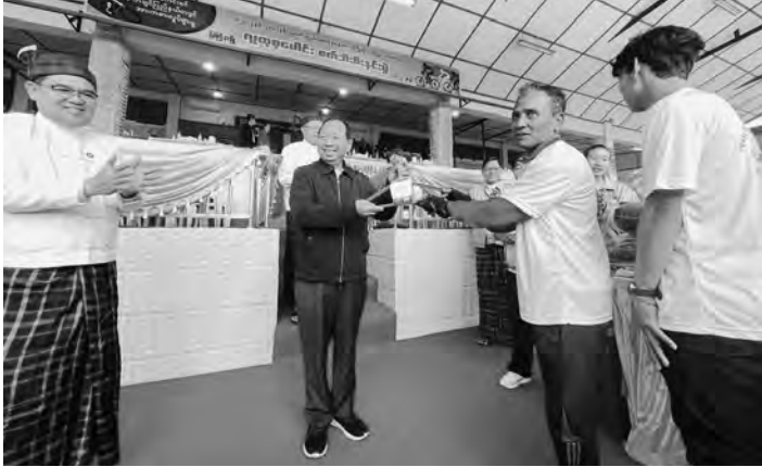
● ကချင်၊ ဖေဖော်ဝါရီလ(၁၁)ရက်။ ၂၀၂၃ ခုနှစ်၊ (၇၆)နှစ်မြောက် ပြည်ထောင်စုနေ့ကို ကြိုဆိုဂုဏ်ပြု သောအားဖြင့် လူထုစုပေါင်း စက်ဘီးစီးနင်းပွဲနှင့် ဆုချီးမြှင့်ပွဲအခမ်းအနားကို ယနေ့နံနက်(၇)နာရီအချိန် ပြည်နယ်