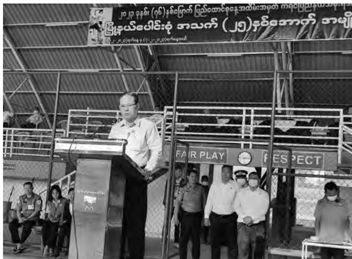
ဌာနဆိုင်ရာများ မှ တာဝန်ရှိပုဂ္ဂိုလ်များ အသီးသီးတက်ရောက်ခဲ့ကြပါသည်။

● ကရင်၊ ဖေဖော်ဝါရီ(၇)ရက်။ (၇၆)နှစ်မြောက် ပြည်ထောင်စုနေ့အထိမ်းအမှတ် ပြည်နယ်ဝန်ကြီးချုပ်ဖလား မြို့နယ်ပေါင်းစုံ အသက် (၂၅)နှစ်အောက် အမျိုးသား ဖူဆယ်ဘောလုံးပြိုင်ပွဲ ဖွင့်ပွဲအခမ်းအနားကို ၂-၂-၂၀၂၃ ရက်နေ့ နံနက် (၈:၀၀) နာရီအချိန်တွင် ကရင်ပြည်နယ် ဘားအံမြို့ ဖူဆယ်အားကစားရုံ၌ ကျင်းပပြုလုပ်ခဲ့ရာ အခမ်းအနားသို့ ကရင်ပြည်နယ်အစိုးရအဖွဲ့၊ ပြည်နယ်ဝန်ကြီးချုပ် ဦးစောမြင့်ဦး၊ ပြည်နယ်တရားလွှတ်တော် တရားသူကြီးချုပ်၊ ဥပဒေချုပ်၊ ပြည်နယ်အစိုးရအဖွဲ့ဝင် ဝန်ကြီးများနှင့် ပြည်နယ်အဆင့်