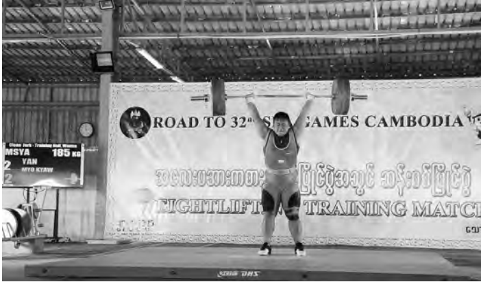
● နေပြည်တော်၊ ဖေဖော်ဝါရီလ(၂၄)ရက်။ ၂၀၂၃ ခုနှစ်တွင် ကမ္ဘောဒီးယားနိုင်ငံက အိမ်ရှင်အဖြစ်လက်ခံကျင်းပမည့် (၃၂)ကြိမ်မြောက် အရှေ့တောင်အာရှအားကစားပြိုင်ပွဲသို့ ဝင်ရောက်ယှဉ်ပြိုင်ရန်အတွက် နေပြည်တော်