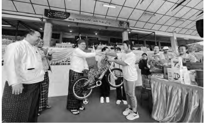
အားကစားကွင်း မြစ်ကြီးနားမြို့တွင် ကျင်းပပြုလုပ်ခဲ့ရာ ကချင်ပြည်နယ် အစိုးရအဖွဲ့ ပြည်နယ်ဝန်ကြီးချုပ် သီရိပျံချီ ဦးခက်ထိန်နန်၊ ပြည်နယ် တရားလွှတ်တော် တရားသူကြီးချုပ်၊ စာမျက်နှာ(၁၆)သို့ ▶