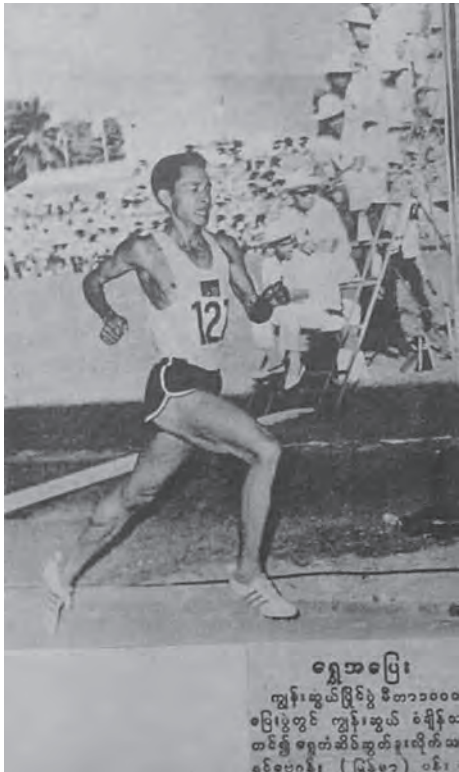
ရွှေအပြေး ကျွန်းဆွယ်မြိုင်ပွဲ ဇီတာ၁၀၀၀ ပြိုင်ပွဲတွင် ကျွန်းဆွယ် ခံချိန် တစ်နှစ် စုစုပေါင်းဆိုင်ဆွတ်ခဲ့ပြီး စင်စစ်ပေးစား ( မြန်မာ ) ဝန်

အပျက်ကြောင့် ၎င်းတို့နှစ်ဦး၏ သတင်းနှင့်ဓာတ်ပုံများ ကမ္ဘာကျော်ခဲ့ပြီး ၎င်းတို့၏ အားကစားစိတ်ဓာတ်ကို လူအများမှ လေးစားဂုဏ်ယူကြပါသည်။ ထို့ပြင် ပါဝင်ယှဉ်ပြိုင်နေသော အားကစားသမားများတွင် အားကစားစိတ်ဓာတ်ရှိရန် လိုအပ်သလို ပွဲကြည့်ပရိသတ်များအနေဖြင့်လည်း သန့်ရှင်းစွာဖြင့် အားပေးကြည့်ရှုရန်လည်း လိုအပ်လှပါသည်။ ယခု ၂၀၂၂ ခုနှစ် ကာတာနိုင်ငံမှ အိမ်ရှင်အဖြစ်လက်ခံကျင်းပနေသော ကမ္ဘာ့ဖလား ဘောလုံးအားကစားပြိုင်ပွဲတွင် ဂျပန်နိုင်ငံ အမျိုးသား ဘောလုံးအသင်းဝင်ရောက်ယှဉ်ပြိုင်ရာ၌ ၎င်းတို့နိုင်ငံ ပရိသတ်များသည် ဂျပန်နိုင်ငံ အမျိုးသားဘောလုံးအသင်းကစားသောပွဲစဉ်များတွင် အိတ်အပြာရောင်များကို ယူဆောင်လာကြပါသည်။ ယူဆောင်လာသည့်အကြောင်းအရင်းမှာ ဂျပန်အမျိုးသား ဘောလုံးအသင်းသည် အင်္ကျီအပြာရောင်၊ ဘောင်းဘီအပြာရောင် ဝတ်ဆင်သောကြောင့် အနိုင်ရရှိသည့်အခါတွင် ၎င်းတို့ပါလာသော အိတ်အပြာရောင်များကိုဖြန့်၍ ပွဲကြည့်စင်တွင် အပြာရောင်များလွှမ်းခြုံစေရန် ရည်ရွယ်ချက်ဖြင့် ယူဆောင်လာခြင်းဖြစ်ပြီး ပွဲပြီးသည့်အချိန်တွင်လည်း ၎င်းတို့အားပေးသည့်အသင်း ရုံးသည်ဖြစ်စေ၊ နိုင်သည်