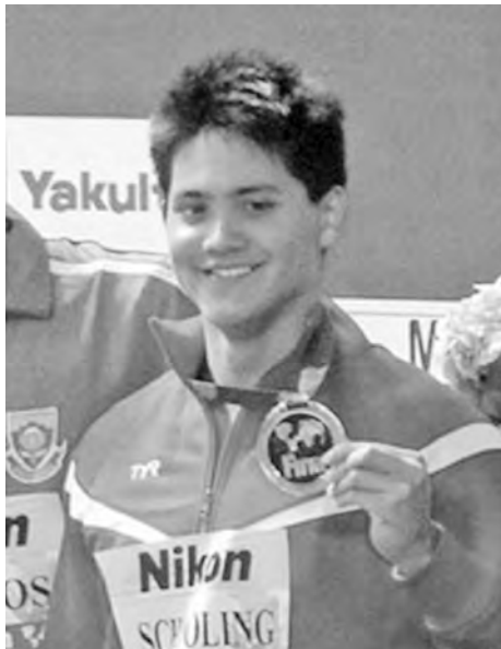
လည်း ပါဝင်ယှဉ်ပြိုင်မည်ဖြစ်ပါသည်။

ထို့အပြင် ဟန့်ရှင်းဆီးဂိမ်းတွင် ငွေတံဆိပ်ရခဲ့ သည့် ကမ္ဘောဒီးယားအားကစားပြိုင်ပွဲတွင် ကျား/မနှစ် ယောက်တွဲချန်ပီယံ တယ်ရီဟီးနှင့်ဂျက်ဆီကာတန် တို့ကဲ့သို့သော စင်ကာပူထိပ်တန်းကစားသမားများ