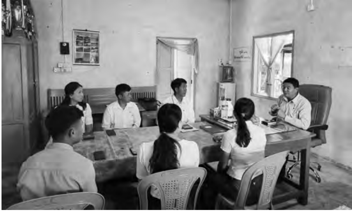
▶ စာမျက်နှာ(၃)သတင်း...မှအဆက်

များမထားဘဲ အသိပညာဗဟုသုတများ တိုးပွားစေရန်နှင့် ပညာဝမ်းစာများ ပြည့်ဝအောင် စာအုပ်၊ စာပေများများ လေ့လာဖတ်ရှု မှတ်သားရန် လိုကြောင်း၊ အထက်အောက် အပြန်အလှန် လေးလေးစားစား ပြောဆို ဆက်ဆံကြရန်နှင့် တစ်ဦးတစ်ယောက်ကောင်းစိတ် မမေးဘဲ အချင်းချင်း ရိုင်းပင်းကူညီ၍ မိသားစုညီအစ်ကို မောင်နှမစိတ်ဓာတ်ထားရှိပြီး ပူးပေါင်းဆောင်ရွက်လုပ်ကိုင်မှသာ လုပ်ငန်းများ အဆင်ပြေချောမွေ့အောင်မြင်နိုင်မည်ဖြစ်ကြောင်း၊ ကျန်းမာရေးနှင့် လုံခြုံရေး အထူးဂရုစိုက်ကြရန်လိုကြောင်း၊ ဝန်ထမ်းများ အခက်အခဲများ၊ လိုအပ်ချက်များရှိပါက တာဝန်ရှိသူများထံ တင်ပြ၍ လမ်းညွှန်ခွင့်ပြုချက် ရယူပြီးမှ လုပ်ကိုင်ဆောင်ရွက်သွားကြရန်နှင့် အားကစားကွင်း/အားကစားရုံများ ရေရှည်တည်တံ့ပြီး အမြဲတမ်းစိမ်းလန်းစိုပြေစေရန်၊ သန့်ရှင်းသပ်ရပ်မှုရှိစေရန်နှင့် ပြည်သူများ ပျော်ရွှင်စွာ လာရောက်လေ့ကျင့် ကစားနိုင်စေရန်အတွက် အားကစားကွင်း/အားကစားရုံများအား ထိန်းသိမ်းဆောင်ရွက်သွား