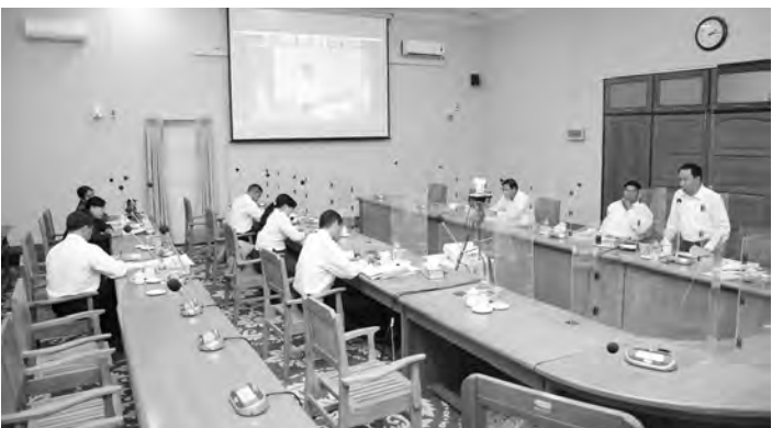
ဌာနခွဲများမှ ညွှန်ကြားရေးမှူးများ ကာယပညာသိပ္ပံ ကျောင်းအုပ်ကြီးများမှ Video Conferencing တက်ရောက်ခဲ့ကြပြီး အားကစားနှင့်

● နေပြည်တော်၊ ဖေဖော်ဝါရီလ(၁၃)ရက်။ အားကစားနှင့် ကာယပညာဦးစီးဌာန ညွှန်ကြားရေးမှူးချုပ် ဦးထွန်းမြင့်ဦးမှ အားကစားနှင့် ကာယပညာသိပ္ပံကျောင်းအုပ်ကြီးများနှင့် လုပ်ငန်းကိစ္စများနှင့် ပတ်သက်၍ သုံးသပ်ညှိနှိုင်းအစည်းအဝေးကို ယနေ့မွန်းလွဲ(၁၂)နာရီခွဲအချိန်တွင် နေပြည်တော်၊ ရုံးအမှတ်(၃၁) အစည်းအဝေးခန်းမ၌ ကျင်းပပြုလုပ်ခဲ့ရာ ဒုတိယညွှန်ကြားရေးမှူးချုပ်များဖြစ်ကြသော ဦးကျော်ဦး၊ ဦးကျော်ဆန်းဦးနှင့် သက်ဆိုင်ရာ