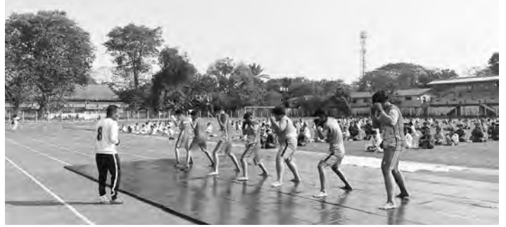
▶▶ နှင့် သရုပ်ပြပွဲတွင် ပါဝင်မည့် သက် ဆိုင်ရာ ကစားသမား (၆၀၀)ဦးခန့် တက်ရောက်ခဲ့ကြပါသည်။ ပထမဦးစွာ ကချင်ပြည်နယ် အစိုးရအဖွဲ့ ဝန်ကြီးချုပ် သီရိပျံချီ ဦးခက်ထိန်နန်မှ အဖွင့်အမှာစကား ပြောကြားပြီး (မြန်မာ့သိုင်း ကျိုခဲရင်း