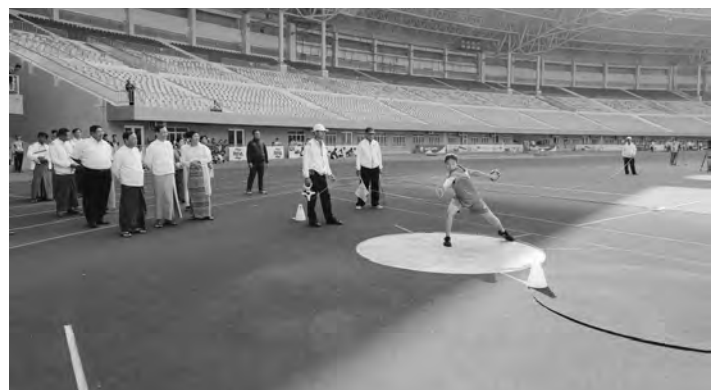
ဝန်ကြီးဌာနဒုတိယဝန်ကြီး ဒေါက်တာ ဇော်မြင့်မှ တစ်ဦးချင်း ဆုတံဆိပ်၊ ငွေသားဆုနှင့် တံခွန်စိုက် ခိုင်းဆုအား လည်းကောင်း အသီးသီး ပေးအပ်

တတိယဆင့် ရရှိသည့် မုံရွာ(EDC) အသင်းကို ပညာရေးဝန်ကြီးဌာန ညွှန်ကြားရေးမှူးချုပ် ဒေါ်နန်းကြည်မှ တစ်ဦးချင်း ဆုဆွဲပြားနှင့် ငွေသားဆု အားလည်းကောင်း၊ ဒုတိယဆင့် ရရှိသည့် တောင်ငူ(EDC)အသင်းကို အားကစားနှင့် လူငယ်ရေးရာဝန်ကြီးဌာန ဒုတိယဝန်ကြီး ဦးမျိုးလှိုင်မှ တစ်ဦးချင်းဆုဆွဲပြားနှင့် ငွေသားဆု အားလည်းကောင်း၊ ပထမဆင့်ရရှိသည့် ရန်ကင်း(EDC)အသင်းကို ပညာရေး