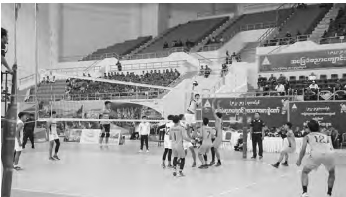
● နေပြည်တော်၊ ဇန်နဝါရီလ(၂၆)ရက်။ မြန်မာ့အားကစား လောက အဆင့်အတန်း တိုးတက်မြှင့်မားလာ စေရန်နှင့် ကျောင်းသားအားကစား ပွဲတော်မှတစ်ဆင့် နိုင်ငံလက်ရွေးစင် အားကစားသမားကောင်းများ စဉ် ဆက်မပြတ် ပေါ်ထွက်လာစေရန် ရည်ရွယ်၍ ယနေ့နံနက်ပိုင်းတွင် နေပြည်တော်၊ ဝဏ္ဏသိဒ္ဓိအားကစားရုံ (B)၌ ၂၀၂၂-၂၀၂၃ ပညာသင်နှစ်၊ အခြေခံပညာကျောင်းသား အားကစား ပွဲတော် ဘော်လီဘော (အမျိုးသား/ အမျိုးသမီး) ပြိုင်ပွဲ(ဗိုလ်လုပွဲ) ပွဲစဉ်