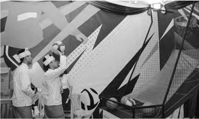
စာမျက်နှာ(၁၄)သို့ ▶

ရိုးရာအစားအစာ ပြခန်း(၁၅)ခန်း၊ စုစုပေါင်းပြခန်း(၅၅)ခန်းနှင့် ဝန်ကြီးဌာနများအလိုက် ကိုယ်စားပြုဂုဏ်ပြုယာဉ်(၂၆)စီးနေပြည်တော်ကောင်စီ၊ တိုင်းဒေသကြီးနှင့် ပြည်နယ်ကိုယ်စားပြု ဂုဏ်ပြုယာဉ်(၁၅)စီး၊ (၇၅)နှစ်မြောက် စိန်ရတုလွတ်လပ်ရေးနေ့ဂုဏ်ပြုယာဉ် (၁)စီး၊ ပြည်ထောင်စုနောက်ပိတ် ဂုဏ်ပြုယာဉ်(၁)စီး၊ တပ်မတော်ကိုယ်စားပြု ဂုဏ်ပြုယာဉ်