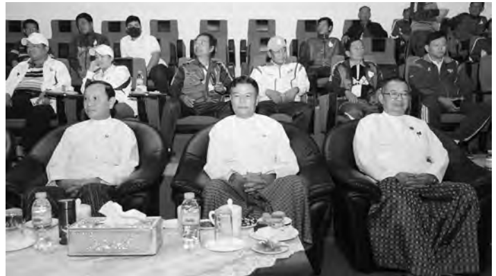
ဗိုလ်လုပွဲ ပွဲစဉ်များအဖြစ်(အမျိုးသား) ပြိုင်ပွဲတွင် ရှမ်းပြည်နယ်အသင်းက ရော့ဝတီတိုင်းဒေသကြီး အသင်းကို (၃)ပွဲ၊(၁)ပွဲဖြင့်လည်းကောင်း၊(အမျိုး သမီး) ပြိုင်ပွဲတွင် တနင်္သာရီတိုင်း ဒေသကြီးအသင်းက ရော့ဝတီတိုင်း ဒေသကြီးအသင်းကို (၃)ပွဲ၊ (၂) ပွဲ ဖြင့်လည်းကောင်း အသီးသီးယှဉ်ပြိုင် အနိုင်ရရှိခဲ့သည်။ ဘော်လီဘော(အမျိုးသား)ပြိုင် ပွဲတွင် ပထမဆုကို ရှမ်းပြည်နယ် အသင်း၊ ဒုတိယဆုကို ရော့ဝတီတိုင်း ဒေသကြီးအသင်းနှင့် ပူးတွဲတတိယ

များကိုကျင်းပလျက်ရှိရာ အားကစား နှင့်လူငယ်ရေးရာ ဝန်ကြီးဌာန ပြည်ထောင်စုဝန်ကြီး ဦးမင်းသိန်းဇံ၊ ဒုတိယဝန်ကြီး ဦးမျိုးလှိုင်၊ ဒုတိယ အမြဲတမ်းအတွင်းဝန် ဦးကျော်ဆန်း၊ ဒုတိယ ညွှန်ကြားရေးမှူးချုပ်များ၊ တပ်မတော်မှ အရာရှိကြီးများ၊ ဌာန ဆိုင်ရာများမှ တာဝန်ရှိပုဂ္ဂိုလ်များ၊ ပြည်နယ်နှင့် တိုင်းဒေသကြီးများမှ အသင်း အုပ်ချုပ်သူ/နည်းပြများနှင့် အားကစားသမားများ တက်ရောက် ကြည့်ရှုအားပေးကြသည်။ ယနေ့ ဘော်လီဘော ပြိုင်ပွဲ