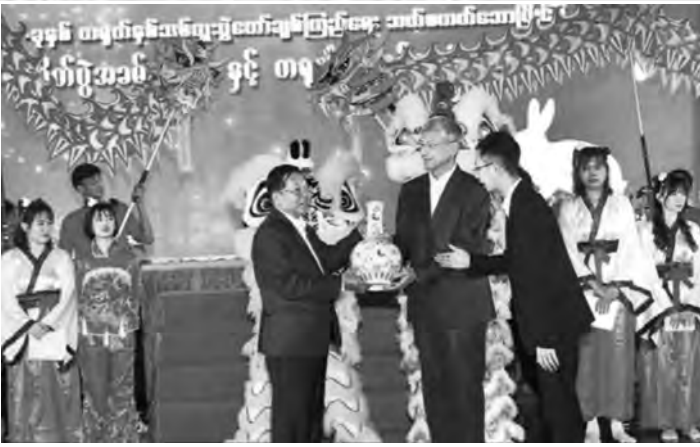
▶ မျက်နှာပိုးသတင်း...ပုအဆက်

ထို့နောက် နိုင်ငံတော်စီမံအုပ်ချုပ်ရေးကောင်စီ ဥက္ကဋ္ဌ နိုင်ငံတော်ဝန်ကြီးချုပ်နှင့်ဇနီး အခမ်းအနားတက်ရောက်လာကြသူများသည် တရုတ်နှစ်သစ်ကူးပွဲတော် ဖွင့်ပွဲအခမ်းအနားကျင်းပမည့်နေရာသို့ ရောက်ရှိကြရာ တာဝန်ရှိသူများက တရုတ်ရိုးရာ ပဝါဖြင့် ဂါရဝပြုကြသည်။