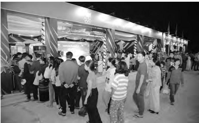
အဆိုပါပြပွဲ၌ ဝန်ကြီးဌာနပြခန်း (၂၅)ခန်း၊ နေပြည်တော်ကောင်စီ တိုင်းဒေသကြီးနှင့် ပြည်နယ်ပြခန်း (၁၅)ခန်း၊ တိုင်းရင်းသားရိုးရာအစား

● နေပြည်တော်၊ ဇန်နဝါရီလ(၇)ရက်။ ၂၀၂၃ ခုနှစ်၊ (၇၅)နှစ်မြောက် စိန်ရတုလွတ်လပ်ရေးနေ့ အထိမ်းအမှတ်အဖြစ် နေပြည်တော် ဥပဒေရေးရာဌာနတော်တော်တော်က တပေါင်းကွင်းအတွင်း၌ ဝန်ကြီးဌာနပေါင်းစုံမှ ပြခန်းများ ပြသထားလျက်ရှိရာ အားကစားနှင့် လူငယ်ရေးရာဝန်ကြီးဌာန ပြည်ထောင်စုဝန်ကြီး ဦးမင်းသိန်းဇံ နှင့်မိသားစုသည် ယမန်နေ့ ညနေပိုင်းတွင် အားကစားနှင့် လူငယ်ရေးရာဝန်ကြီးဌာန ကိုယ်စားပြုပြခန်းသို့ လာရောက်ကြည့်ရှု အားပေးခဲ့သည်။