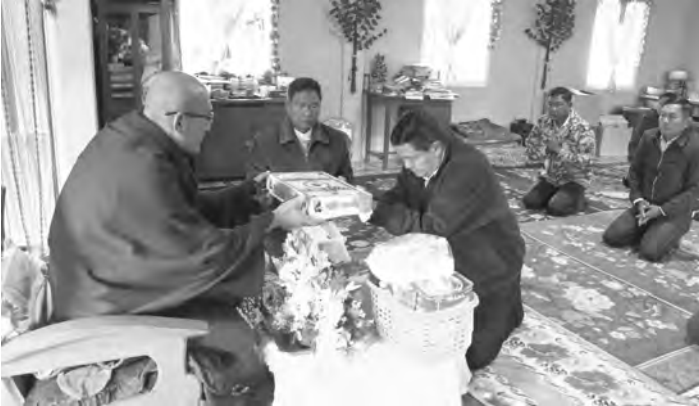
● နေပြည်တော်၊ ဇန်နဝါရီလ(၂၉)ရက်။ အားကစားနှင့် လူငယ်ရေးရာ ဝန်ကြီးဌာန ပြည်ထောင်စုဝန်ကြီး ဦးမင်းသိန်းဇံသည် နာဂဒေသကိုယ်

ပိုင်အုပ်ချုပ်ခွင့်ရဒေသ စီမံအုပ်ချုပ် ရေးဥက္ကဋ္ဌ ဦးထွန်းထွန်းဝင်း၊ အတွင်း ရေးမှူး ဦးနေမင်းသူနှင့် တာဝန်ရှိသူ များလိုက်ပါလျက် ယနေ့နံနက်(၈)