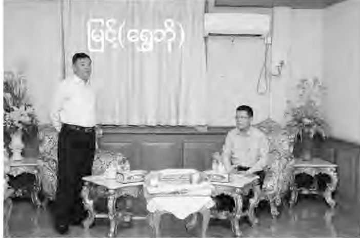
မေတ္တာထားပြီး ပြုစုပို့ဆောင်၍ ဆုံးမ သွန်သင်ပေးရန် လိုကြောင်း ပြောကြား ခဲ့ပါသည်။ ဆက်လက်၍ ပြည်ထောင်စု

နောက်ကျောပုံးသတင်း... မှ စာဆက် အားကစားကွင်းသို့ သွားရောက်ကြည့်ရှုစစ်ဆေးခဲ့ပြီး Ayeyawaddy United FC မှ ဘောလုံးအားကစားသမားများနှင့် ရင်းရင်းနှီးနှီးတွေ့ဆုံ နှုတ်ဆက်စကားပြောကြားရာတွင် အသင်းအဖွဲ့စိတ်ဓာတ်ထားရှိရန်နှင့် စုပေါင်းညီညွတ်မှုရှိမှု အောင်မြင်မှု ရရှိနိုင်မည်ဖြစ်ကြောင်း၊ နောက်ဆုံးအချိန်အထိ ငွေမလျော့ဘဲ မဆုတ်မနစ်သော စိတ်ဓာတ်ဖြင့် အားသွန် ခွန်စိုက်ကြိုးစားလေ့ကျင့်ကြရန်လိုကြောင်း၊ နည်းပြများကလည်း အားကစားသမားများအပေါ် မိသားစုသဖွယ် စေတနာ၊