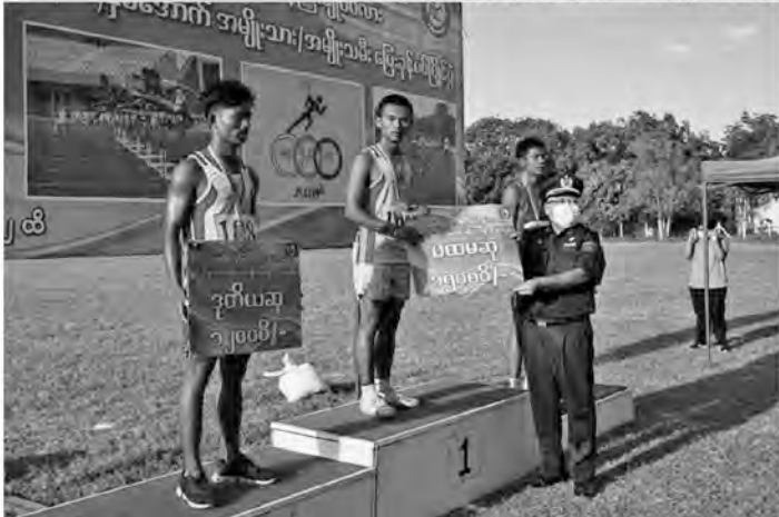
စာဖျက်(၁၅) - ပုစာဆက်

သမားများ ဖြစ်လာသည်အထိ ကြီးစားကြစေလိုကြောင်း ပြောကြားကာ၊ ပြေးခုန်ပစ်ပြိုင်ပွဲအား ဖွင့်လှစ်ပေးခဲ့သည်။