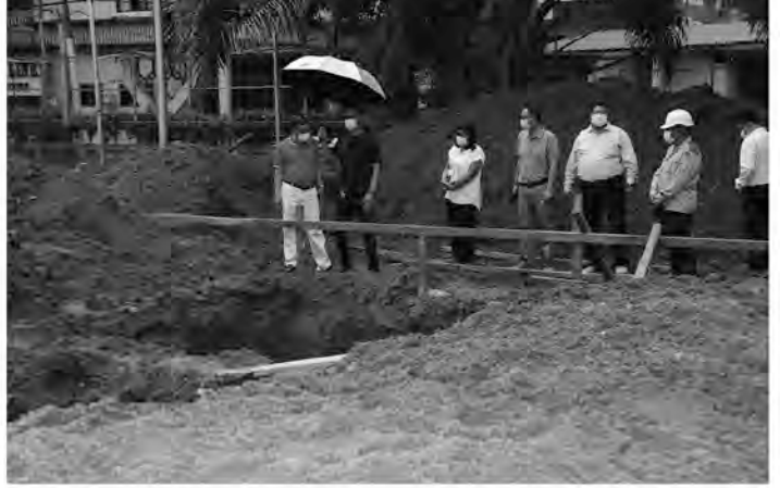
▶ စာမျက်နှာ(၅၃)မှစာအုပ်

သေနတ်ပစ်အားကစားအဖွဲ့ချုပ်ရှိ စားရိပ်သာအား ဝင်ရောက် ကြည့်ရှုစစ်ဆေးခဲ့ပါသည်။