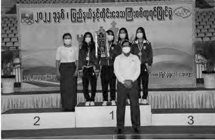
▶ စာမျက်နှာ(၃၁) - မှစတင်

ဦးထွန်းမြင့်ဦးက အပြည်ပြည်ဆိုင်ရာ စစ်တုရင်လူငယ်(အသင်းလိုက်)ပြိုင်ပွဲတွင် ပထမရရှိသော (မွန်ပြည်နယ်) အသင်း၊ ဒုတိယရရှိသော (မန္တလေးတိုင်းဒေသကြီး)အသင်း၊ တတိယရရှိသော(ရှမ်းပြည်နယ်)အသင်း တို့အား တစ်ဦးချင်းဆုတံဆိပ်နှင့် ငွေသားဆုများကိုလည်းကောင်း၊ ရန်ကုန်တိုင်းဒေသကြီးအစိုးရအဖွဲ့ သယ်ဇာတရေးရာဝန်ကြီး ဦးဇော်ဝင်းက