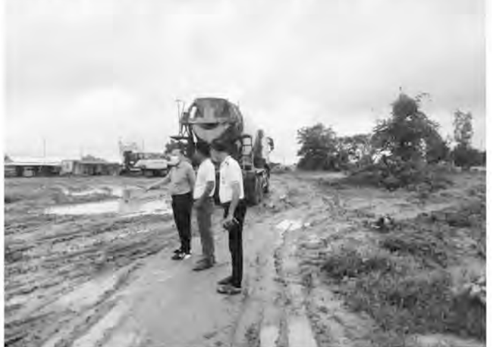
အရည်အသွေးနှင့် စံချိန်စံညွှန်း ကောင်း မွန်ပြီး သတ်မှတ်ကာလအတွင်း အချိန်မီဆောက်လုပ်ပြီးစီးစေရေး အလေးထားဆောင်ရွက်သွားကြရန် တာဝန်ရှိသူများအား လမ်းညွှန် မှုန်ပြီး သတ်မှတ်ကာလအတွင်း ကြားခဲ့ကြောင်း သတင်းရရှိပါသည်။

ထို့နောက် ဒုတိယဝန်ကြီးနှင့် အဖွဲ့သည် ပဲခူးတိုင်းဒေသကြီး၊ ပဲခူးမြို့ အားကစားဥယျာဉ်စီမံကိန်းမြေနေရာ၌ တည်ဆောက်လျက်ရှိသည့် အရှေ့ ဘက် ရိုးရိုးတန်းပွဲကြည့်စင်၊ အနောက် ဘက်အထူးတန်း ပွဲကြည့်စင်နှင့် မိုးလုံ လေလုံအားကစားရုံ တည်ဆောက်နေ မှုတို့အား သွားရောက်ကြည့်ရှုစစ်ဆေး ခဲ့ပြီး အားကစားကွင်း/အားကစားရုံ အဆောက်အဦများအား သတ်မှတ်