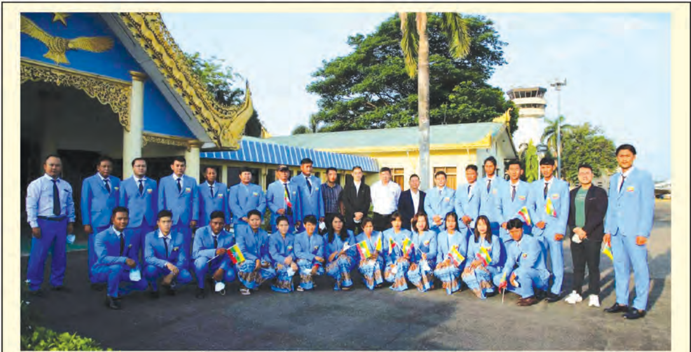
၄-၅-၂၀၂၂ ရက်နေ့တွင် (၃၁)ကြိမ်မြောက် အရှေ့တောင်အာရှ အားကစားပြိုင်ပွဲသို့ ဝင်ရောက်ယှဉ်ပြိုင်ရန်အတွက် မြန်မာအားကစားအဖွဲ့ ပဉ္စမအသုတ်ထွက်ခွာ

အားကစားနည်းမှ အမျိုးသား (၁၇)ဦး၊ အမျိုးသမီး (၈) ဦး၊ အလေးမအားကစားနည်းမှ အမျိုးသား (၄)ဦး၊ အမျိုးသမီး (၄)ဦးတို့ပါကြောင်း သိရှိရသည်။