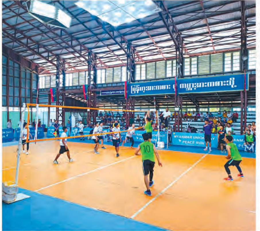
◆ တနင်္သာရီ၊ ငလေ(သ)ရက်နေ့၊ အဖိုးသမီး ဘော်လီဘောပြိုင်ပွဲ ပိုင်းလှပွဲနှင့် ဆုချီးမြှင့်ခြင်း အခမ်းအနားကို ထားဝယ်မြို့၊ ရွှေဝယ်သီရိအားကစားခန်းမ၌ ကျင်းပပြုလုပ်ခဲ့ရာ တိုင်းဒေသကြီးအစိုးရ အဖွဲ့ဝင် ဝန်ကြီး များမှ ဆုများပေးအပ်ချီးမြှင့်ခဲ့ပါသည်။