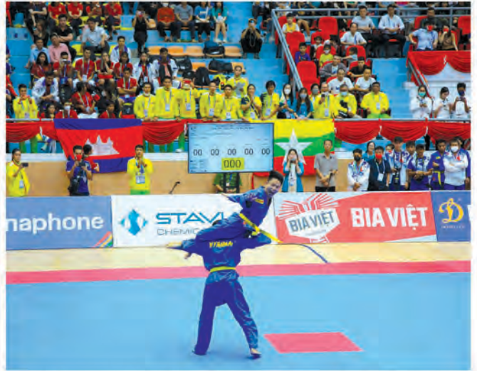
အထိ ရွှေ (၉) ခု၊ ငွေ (၁၈) ခု၊ ကြေး (၃၅) ခုတို့ ဆွတ်ခူးရရှိထားပြီး စုစုပေါင်းဆုတံဆိပ် (၆၂) ခုဖြင့် နိုင်ငံအလိုက် အဆင့်ရပ်တည်မှု အဆင့် (၇) တွင် ရပ်တည်လျက်ရှိကြောင်း သတင်းရရှိသည်။

Bac Ninh Gymnasium အားကစားရုံ၌ ကျင်းပလျက်ရှိသည့် လက်ဝှေ့အားကစားနည်းမှ မြန်မာအားကစားသမားများ၏ ယှဉ်ပြိုင်ကစားနေမှုကိုလည်းကောင်း၊ Soc Son Gymnasium အားကစားရုံ၌ ကျင်းပလျက်ရှိသည့် ဝိုစီနမ်အားကစားနည်းမှ မြန်မာအားကစားသမားများ၏ ယှဉ်ပြိုင်နေမှုများအား သွားရောက်ကြည့်ရှုအားပေးခဲ့ပြီး ဆုရရှိသူများအား ဆုများပေးအပ်ချီးမြှင့်ခဲ့ပါသည်။ ယနေ့ပြိုင်ပွဲပွဲစဉ်များအဖြစ် သေနတ်ပစ်၊ အလေးမ၊ ဂျူဒို၊ ဝိုစီနမ်၊ လက်ဝှေ့ အားကစားပြိုင်ပွဲများကို ကျင်းပခဲ့ပြီး မြန်မာနိုင်ငံမှ ယနေ့