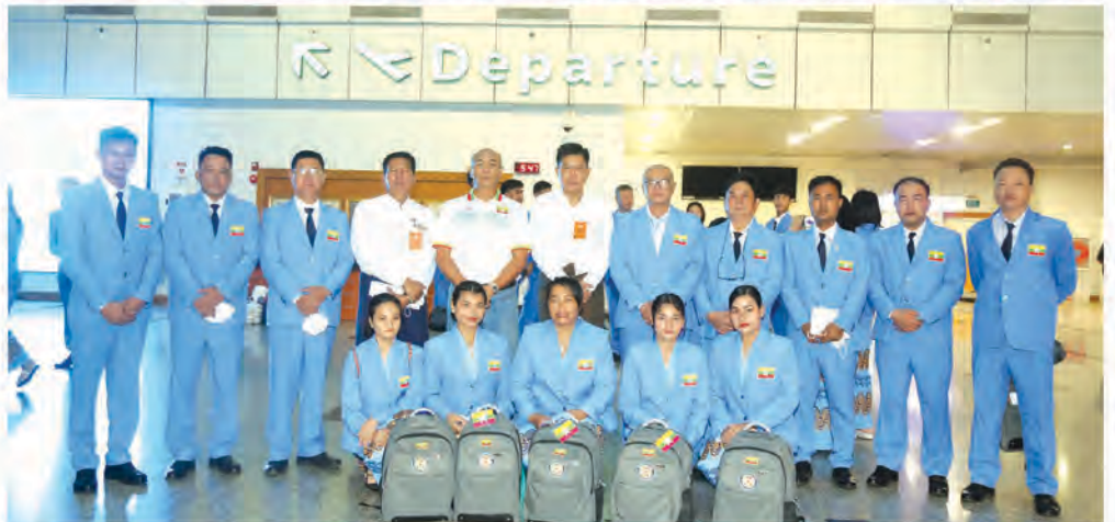
ဖြင့်လည်းကောင်း မြန်မာ့လေကြောင်း စင်းလုံးငှားလေယာဉ်ဖြင့် ရန်ကုန်