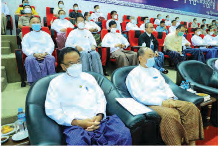
စာမျက်နှာ(၁၁)၁၅

ထက်တစ်နှစ် စီမံဝင်တိုးတက်လာစေပြီး မြန်မာ့ရိုးရာယဉ်ကျေးမှု အမွေအနှစ် တစ်ရပ်အဖြစ် ထိန်းသိမ်းမြှင့်တင်ရန်နှင့် မျိုးချစ်စိတ်ဓါတ်ရှင်သန်ထက်မြက်လာစေရေးတို့အတွက် ယခုကဲ့သို့ပြိုင်ပွဲများကို ကျင်းပပြုလုပ်ပေးခြင်းဖြစ်ပါကြောင်း၊ ခြင်းလုံးခတ်ကစားခြင်းသည် မြန်မာ့ယဉ်ကျေးမှုကို အခြေခံသည့် ရိုးရာအားကစားနည်းဖြစ်သည်အပြင် ပြည်သူများ လက်