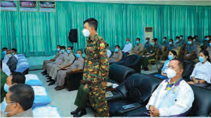
စာမျက်နှာ(၂၃)- အားကစားနှင့်လူငယ်ရေးရာဝန်ကြီးဌာန ပြည်ထောင်စုဝန်ကြီး ဦးမင်းသိန်းစံ အပြည်ပြည်ဆိုင်ရာ အစည်းအဝေး

နည်းပညာများ၊ ပြိုင်ပွဲလုပ်ငန်းစဉ်များ၊ စည်းကမ်းများနှင့် ပြစ်ဒဏ်များအား သိရှိစေရန်နှင့် နိုင်ငံတကာပြိုင်ပွဲများတွင် သေနတ်ပစ်အားကစားနည်းဖြင့် နိုင်ငံ့ဂုဏ်မြှင့်တင် နိုင်စေရန် ရည်ရွယ်ချက်ဖြင့် ယခုသင်တန်းကို ဒုတိယအကြိမ် ဖွင့်လှစ်ခြင်းဖြစ်ပါကြောင်း၊ အိုလံပစ် အားကစားပြိုင်ပွဲ၊ အာရှအားကစားပြိုင်ပွဲ၊ အရှေ့တောင်အာရှအားကစားပြိုင်ပွဲနှင့် အခြားအပြည်ပြည်ဆိုင်ရာ ပြိုင်ပွဲများတွင် နိုင်ငံ့ဂုဏ်ဆောင်ခဲ့ကြသည့် တပ်မတော်သားအားကစားသမားများ များစွာ ပေါ်ထွက်ခဲ့သည်ကို တွေ့မြင်နိုင်မည် ဖြစ်ပါကြောင်း၊ “အားကစား မြှင့်တင်ခြင်းသည် နိုင်ငံတော်ကို ကာကွယ်စောင့်ရှောက်နေခြင်းဖြစ်ပါသည်” ဟူသော ဆောင်ပုဒ်နှင့်အညီ အားကစားနည်းများစွာထဲမှ သေနတ်ပစ်အားကစားနည်း ဖွံ့ဖြိုးတိုးတက်စေရန် ဆောင်ရွက်ပေးခြင်းဖြင့် နိုင်ငံတော်ကို ကာကွယ် စောင့်ရှောက်ရန် ပိုမိုလက်တွေ့ကျထိရောက်မည်ဖြစ်ပါကြောင်း၊ ယခုသင်တန်းသို့ တက်ရောက်လာသော သင်တန်းသားများအနေဖြင့် သင်တန်းမှ သင်ကြားပြသလိုက်သော သင်ခန်းစာများကို နား