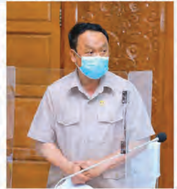
စာမျက်နှာ(၅) အားကစားနှင့်လူငယ်ရေးရာဝန်ကြီးဌာန ပြည်ထောင်စုဝန်ကြီး ဦးမင်းသိန်းစံ ။ပုအဆက်

ပြည်ထောင်စုဝန်ကြီးနှင့်ဝန်ထမ်း ဒုတိယဝန်ကြီးတို့က ငါးမြစ်ချင်းသားပေါက်များကို ဦးဆောင် ငါးမျိုးစိုက် ထည့်ပေးခဲ့ပြီး ညွှန်ကြားရေးမှူးချုပ်များ၊ ဒုတိယ ညွှန်ကြားရေးမှူးချုပ်များ၊ ညွှန်ကြားရေးမှူးများနှင့် ဌာနဆိုင်ရာ အရာထမ်း/အမှုထမ်းများက ဆက်လက်၍ ကန်အတွင်းသို့ ငါးမြစ်ချင်းသားပေါက် ကောင်ရေ(၁၅၀၀၀)ခန့်ကို ငါးမျိုးစိုက်ထည့်ပေးခဲ့ကြပါသည်။