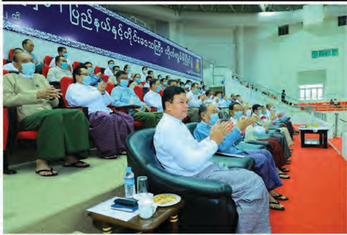
စာမျက်နှာ(၂၀)သို့ ▶

အမျိုးသား (၄၆-၅၀)ကီလိုတန်း၊ အမျိုးသား (၆၃-၆၈)ကီလိုတန်း၊