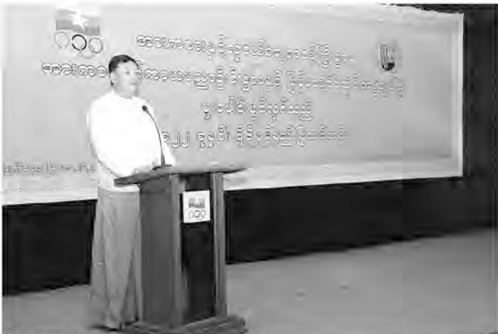
စာမျက်နှာ(၁၅)ညီ

အားကစားနှင့် ကာယပညာသိပ္ပံကျောင်းအုပ်ကြီးများအနေဖြင့် ဝန်ထမ်းများအား စီမံ/အုပ်ချုပ်ကွပ်ကဲရာတွင် စိတ်ရည်ပြီး လုပ်ငန်းဆောင်ရွက်ချက်