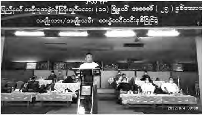
● မွန်ပြည်နယ်၊ ဩဂုတ်လ(၄)ရက်။

၂၀၂၂ခုနှစ်၊ မွန်ပြည်နယ်အစိုးရအဖွဲ့ ဝန်ကြီးချုပ်ဖလား(၁၀)မြို့နယ်အသက်(၂၅)နှစ်အောက် အမျိုးသား/အမျိုးသမီး စားပွဲတင်တင်းနစ်ပြိုင်ပွဲ ဖွင့်ပွဲအခမ်းအနားကို ယနေ့ နံနက် (၉)နာရီအချိန်တွင် ပြည်နယ် အားကစားခန်းမ၌ ကျင်းပပြုလုပ်ခဲ့ရာ မွန်ပြည်နယ်အစိုးရအဖွဲ့ဝန်ကြီးချုပ် ဦးဇော်လင်းထွန်းမှ အဖွင့်အမှာစကား