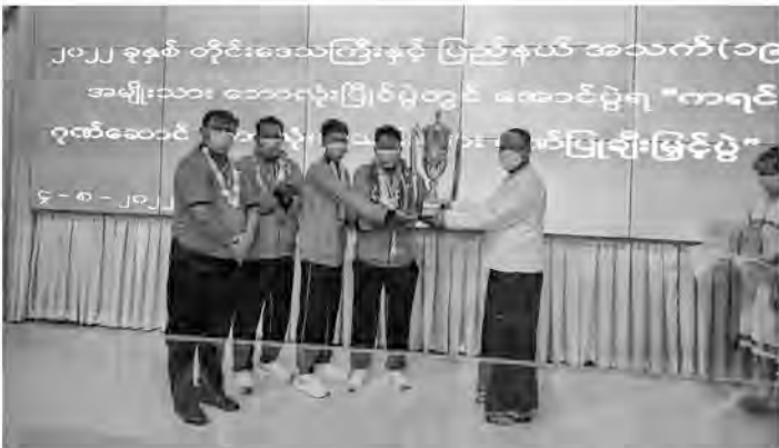
▶ စာမျက်နှာ(၂၃) ...မှစတင်

အသင်းအား ကရင်ပြည်နယ် အစိုးရအဖွဲ့ ပြည်နယ်ဝန်ကြီးချုပ် ဦးစောမြင့်ဦးမှ ဂုဏ်ပြုချီးမြှင့်ငွေ ကျပ်သိန်း(၅၀)နှင့် အုပ်ချုပ်မှုအဖွဲ့အား ငွေကျပ်(၁၀)သိန်း တို့အားလည်းကောင်း၊ အောင်ပွဲရ ကရင်ပြည်နယ် အသက်(၁၉)နှစ်အောက် အမျိုးသားဘောလုံးအသင်း