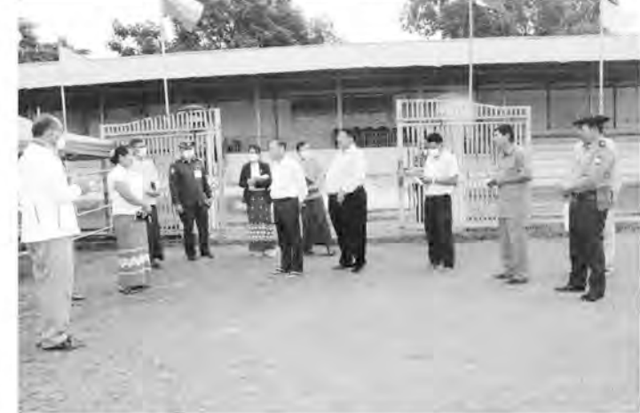
မြို့နယ် အားကစားနှင့်ကာယပညာ ဦးစီးဌာန၊ ကျုံပျော်မြို့နယ် အားကစား နှင့်ကာယပညာဦးစီးဌာနများရှိ အား ကစားကွင်း/အားကစားရုံများအား