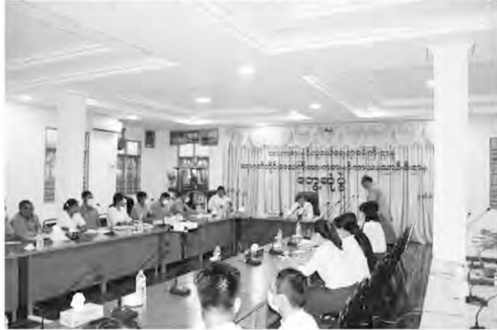
ငန်းတာဝန် ဆောင်ရွက်နေမှုများအား ရှင်းလင်းတင်ပြခဲ့ကြပြီးနောက် ဒုတိယ

တစ်ဦးချင်းမိတ်ဆက်၍ တိုင်းဒေသကြီး ညွှန်ကြားရေးမှူးနှင့်ခရိုင်လက်ထောက် ညွှန်ကြားရေးမှူးများမှ ၎င်းတို့၏ လုပ်