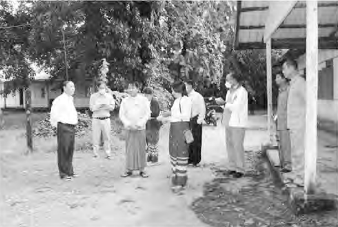
သည် အားကစားနှင့်ကာယပညာဦးစီး ဌာန ဒုတိယညွှန်ကြားရေးမှူးချုပ်